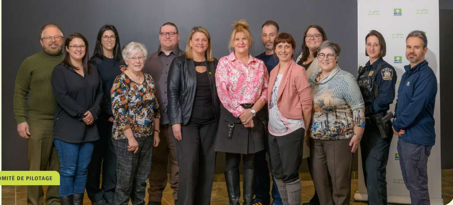
COMITÉ DE PILOTAGE