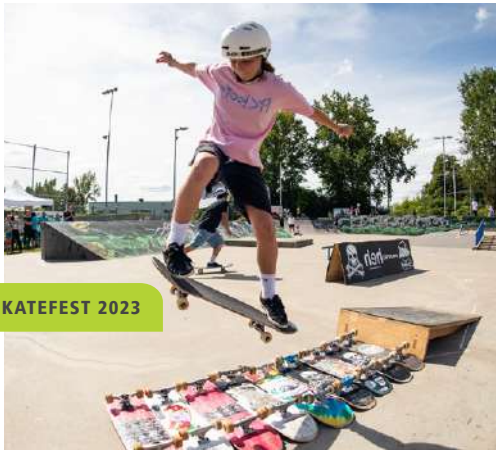
Planche à roulettes